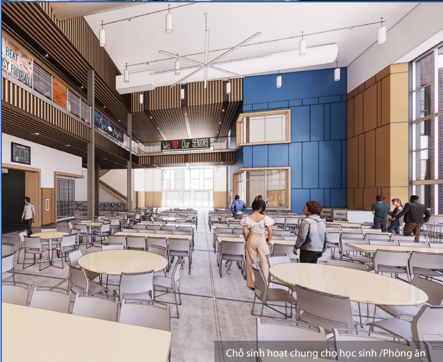
Chỗ sinh hoạt chung cho học sinh / Phòng ăn