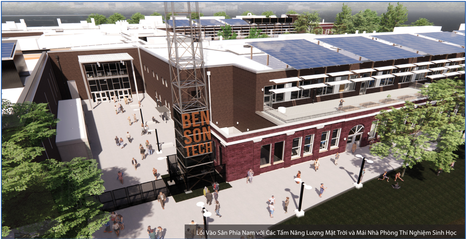
Lối Vào Sân Phía Nam với Các Tấm Năng Lượng Mặt Trời và Mái Nhà Phòng Thí Nghiệm Sinh Học